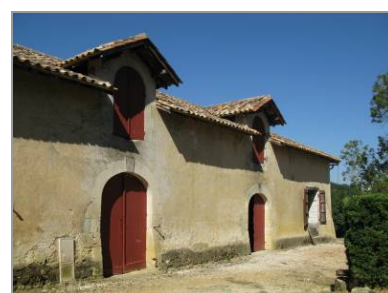
Chai au Mérim d'Or.