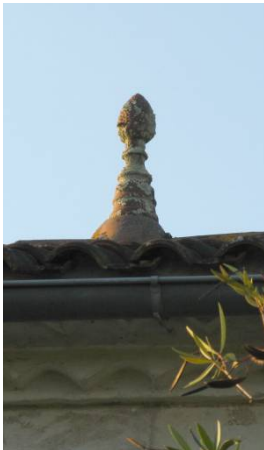
Un épi de faitage en forme de pomme de pin Chez-Signoret.

La plupart des maisons et des logements des fermes ou anciennes fermes (65 sur les 80 étudiés) présentent les caractéristiques de la maison de type saintongeais :