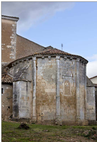
Le chevet roman de l'église (C. Rome).