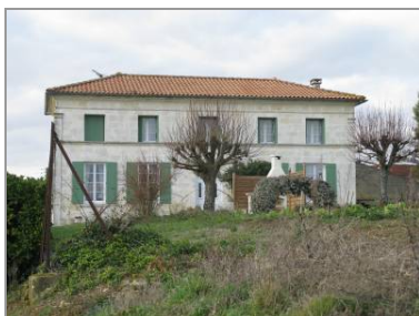
... abandonné en 1863 au profit de celui-ci.

Plus de la moitié des maisons et fermes considérées ont été construites ou reconstruites au 19 e siècle, en particulier au cours des années 1850-1870, période de prospérité pour cette région viticole. Un nombre significatif de bâtiments (soit 14) conserve toutefois des éléments des 17 e et 18 e siècles. Il s'agit d'éléments isolés (par exemple une porte en plein cintre, Chez-Signoret), d'une date inscrite (1678 au Pas-de-Poupot, 1783 au Mérim-d'Or), de bâtiments qui ont subi peu de modifications depuis cette époque ou qui ont conservé en tout cas leur emplacement au sol (par exemple la ferme Chez-Rullière). Les bâtiments construits au 20 e siècle sont relativement peu nombreux, signe du recul démographique que connaît la commune depuis plus d'un siècle. Deux d'entre eux, au Pas-de-Poupot et à la Déchandrie, construits dans les années 1920-1930, se distinguent par leur architecture dite de villégiature, empruntant formes, matériaux et couleurs aux constructions de bord de mer.