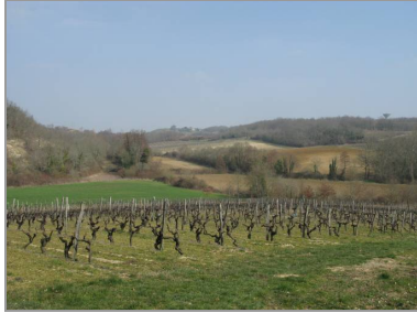
Vignes et bois, paysage du coteau.