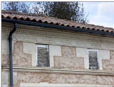
Détail d'une façade dans le bourg.