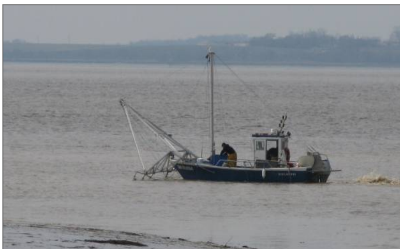
Bateau de pêche au large de Vitrezay.

Aujourd'hui, les activités agricoles et viticoles se maintiennent sur quelques grands domaines, de même que la pêche, en particulier au port de Vitrezay. Le tourisme, lié à la protection de l'environnement et à la mise en valeur des paysages de l'estuaire, ainsi que la villégiature estivale constituent de nouvelles perspectives. La protection des marais contre les inondations est un autre enjeu révélé par les tempêtes de 1999 et de 2010, au cours desquelles l'eau a franchi la digue parallèle à l'estuaire. La surélévation de cette dernière après la tempête de 1999 a toutefois limité l'inondation en 2010, sans empêcher les dégâts aux ports.