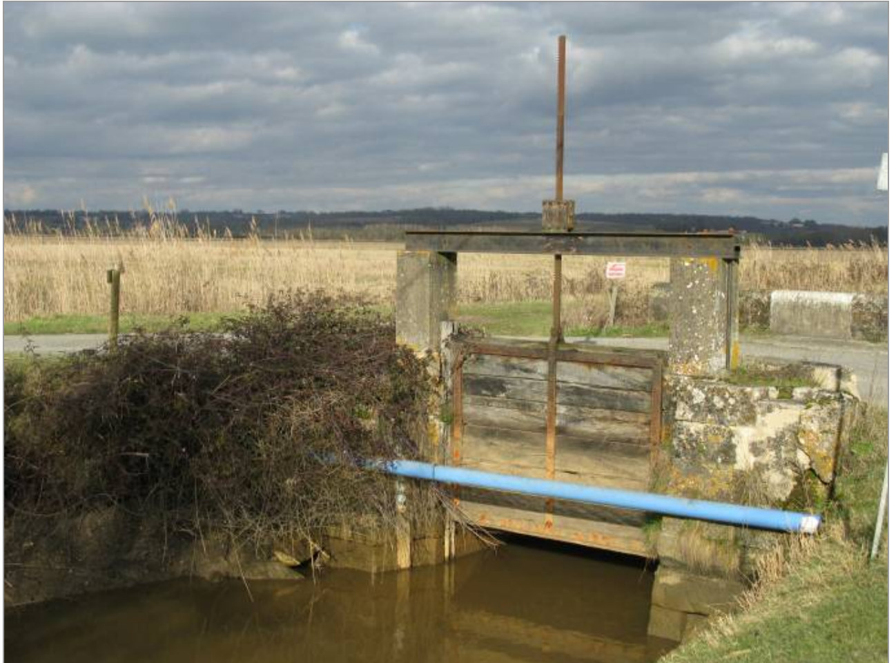
Sur les canaux de dessèchement, le niveau d'eau est contrôlé par des écluses comme celle-ci.