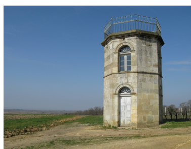
Belvédère près du Château Saint-Sorlin.