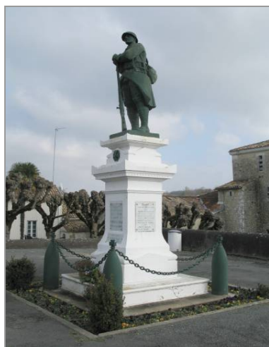
Le monument aux morts.

La crise du phylloxéra marque une rupture dans cette évolution. Saint-Sorlin-de-Cônac est une des dernières communes touchées dans le canton de Mirambeau, en 1879. Si les grands domaines viticoles parviennent à rebondir, grâce notamment à l'action de Félix Carrière au Château Saint-Sorlin, la paysannerie sort ruinée de cette crise. Dans le même temps, l'activité des ports de Vitrezay et de Cônac commence à décliner. Le nombre d'habitants chute à 396 en 1881, puis se redresse un peu jusqu'à la Première Guerre mondiale (463 habitants en 1911). L'arrivée de l'électricité à partir de 1922 et l'ouverture d'une ligne d'autobus reliant Bordeaux en 1924 et d'une agence postale en 1927, n'empêchent pas l'exode rural de produire ses effets dès l'Entre-deux-guerres. En 1936, la commune compte 401 habitants.