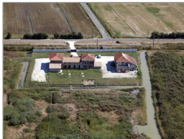
Le Magasin, ferme isolée dans les marais desséchés.