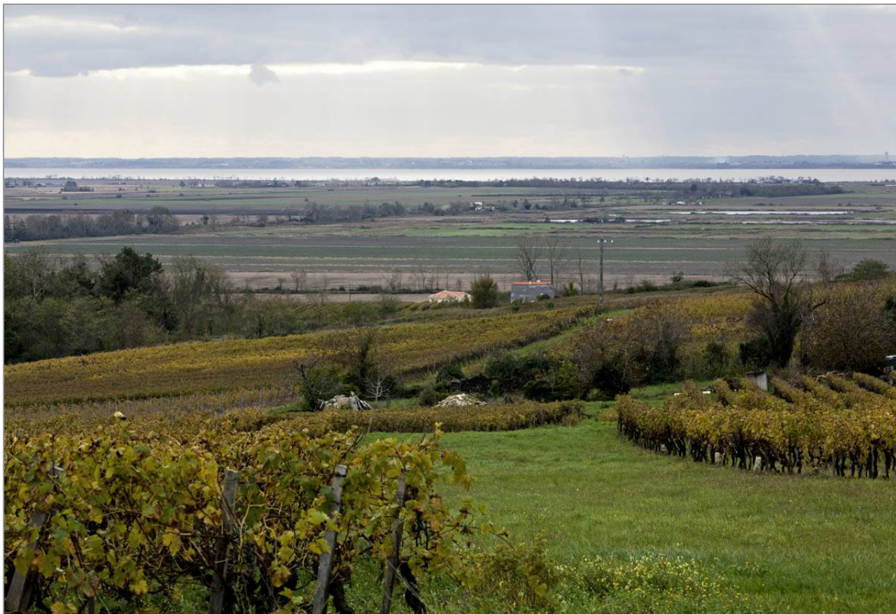
Le coteau, les marais et l'estuaire, à la Déchandrie (C. Rome).