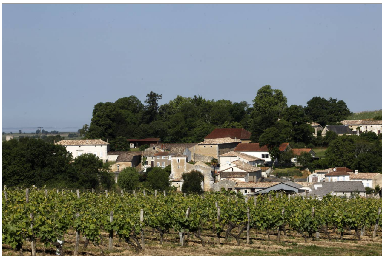
Les vignes, le bourg et l'estuaire (G. Beauvarlet).