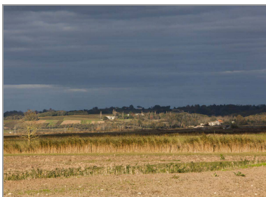
Les marais desséchés et, à l'arrière-plan, le coteau.