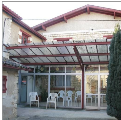
Préau de l'ancienne école primaire à la Déchandrie.