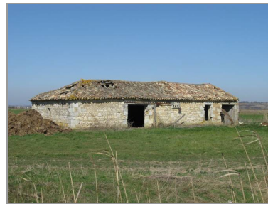
La Petite Métairie, avec le logement à droite et l'étable à gauche.