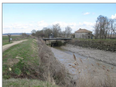
... est évacuée par les portes de Côtac (au centre sur la photo) pour suivre un chenal jusqu'à la mer.