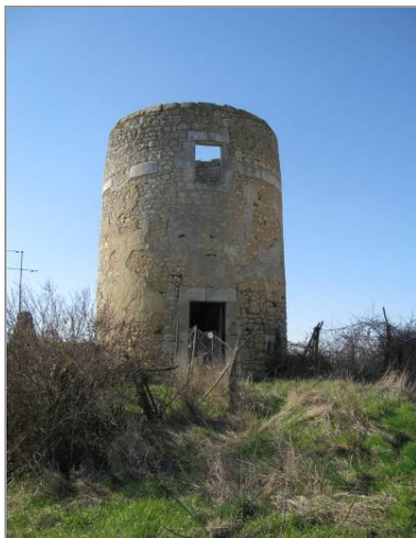
Moulin de la Grenouille.