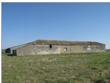
La ferme de la Parisienne.

À la Révolution, la nouvelle commune prend provisoirement le nom de Cônac-la-Vallée. Les biens d'Armand-Emmanuel de Richelieu, comte de Chinon, futur Premier ministre sous la Restauration, sont saisis et vendus comme biens nationaux. Plusieurs notables locaux se portent acquéreurs de ses métairies, en particulier Jérémie Fourestier. Ce protestant est issu de la famille Le Fourestier originaire de Saint-Ciers-du-Taillon, mentionnée depuis le 13 e siècle et qui compte un écuyer du roi Charles VII. Les Fourestier sont rentrés en France à la fin du 18 e siècle après avoir fui à la suite de la révocation de l'édit de Nantes en 1685. Jérémie Fourestier commence, par l'achat de biens nationaux, à se constituer une grande propriété dans la commune.