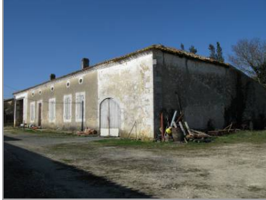
Ferme avec dépendances de chaque côté et à l'arrière du logis, à la Déchandrie.