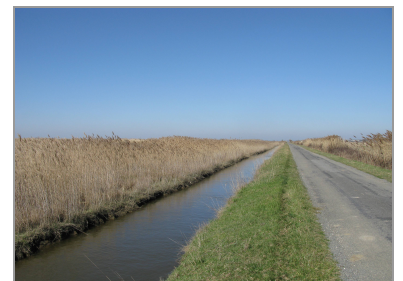
Roseaux, canal et route dans les marais desséchés.