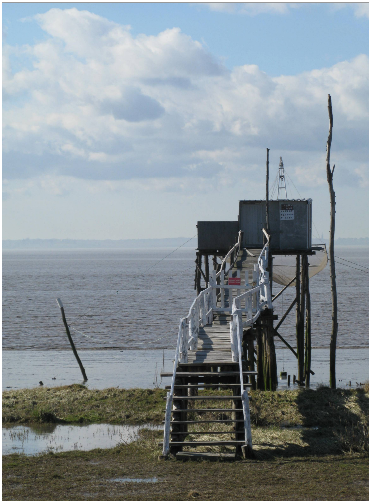
Carrelet au bord de l'estuaire.