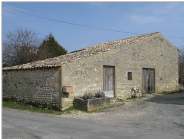
Chai en appentis, à l'arrière du logis de ferme, aux Pasquiers.