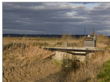
Écluse de chasse du port de Cônac.