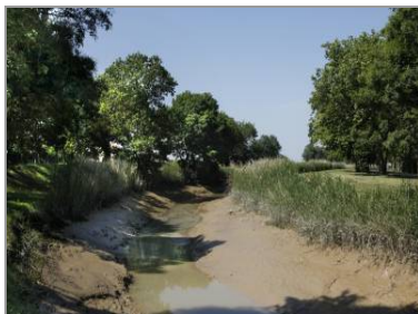
Le chenal de Vitrezay ou de Saint-Bonnet.

Les premières traces d'occupation humaine, favorisée par le recul de la mer, remontent à 12 000 ans, sous la forme de quelques silex taillés mis au jour vers les moulins de la Déchandrie. Aux Cheminées, une station de la fin du Paléolithique et un site à sel du premier âge du Fer ont été repérés. Une « tombelle » (monticule de terre ou de pierre servant de sépulture) de l'époque gauloise a donné son nom au lieu-dit « la Mothe » où elle était encore observée au milieu du 19 e siècle. Quelques poteries datant de l'époque gallo-romaine ont été découvertes près des Cheminées et du moulin de la Grenouille.