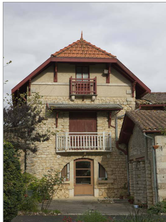
Architecture de villégiature à la Déchandrie, 1926.

Plus de la moitié des maisons et fermes considérées ont été construites ou reconstruites au 19 e siècle, en particulier au cours des années 1850-1870, période de prospérité pour cette région viticole. Un nombre significatif de bâtiments (soit 14) conserve toutefois des éléments des 17 e et 18 e siècles. Il s'agit d'éléments isolés (par exemple une porte en plein cintre, Chez-Signoret), d'une date inscrite (1678 au Pas-de-Poupot, 1783 au Mérim-d'Or), de bâtiments qui ont subi peu de modifications depuis cette époque ou qui ont conservé en tout cas leur emplacement au sol (par exemple la ferme Chez-Rullière). Les bâtiments construits au 20 e siècle sont relativement peu nombreux, signe du recul démographique que connaît la commune depuis plus d'un siècle. Deux d'entre eux, au Pas-de-Poupot et à la Déchandrie, construits dans les années 1920-1930, se distinguent par leur architecture dite de villégiature, empruntant formes, matériaux et couleurs aux constructions de bord de mer.