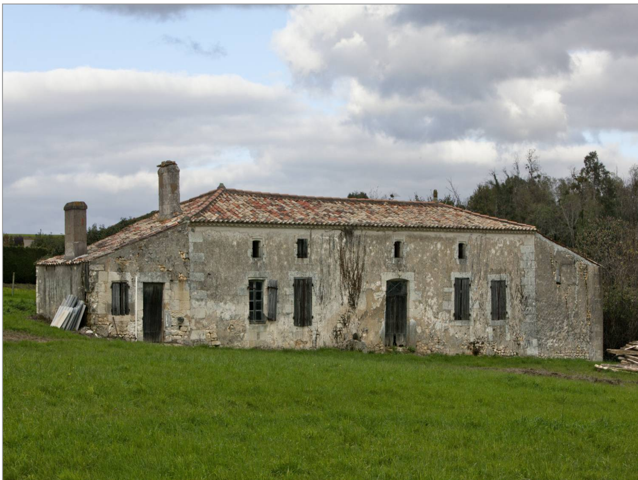
La ferme Chez-Rullière dans le bourg, fin du 18 e siècle ou début du 19 e (C. Rome).