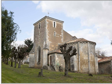
L'église (C. Rome).