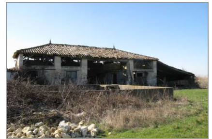
Ancienne grange-étable dans les marais desséchés, à la Bordelaise.

Un tiers des fermes ou anciennes fermes implantées sur le coteau possède parmi les dépendances un chai qui témoigne de l'importante activité viticole de la paysannerie dans la commune au 19e siècle. Placé à proximité du logement, souvent dans son prolongement ou en appentis à l'arrière, le chai possède presque toujours des ouvertures en plein cintre. Certaines sont placées en hauteur pour permettre le déchargement et le chargement du produit de la vendange en charrette. On remarque aussi parfois des boulins (trous) à pigeons placés dans le mur d'une dépendance et regroupés dans une mouluration.