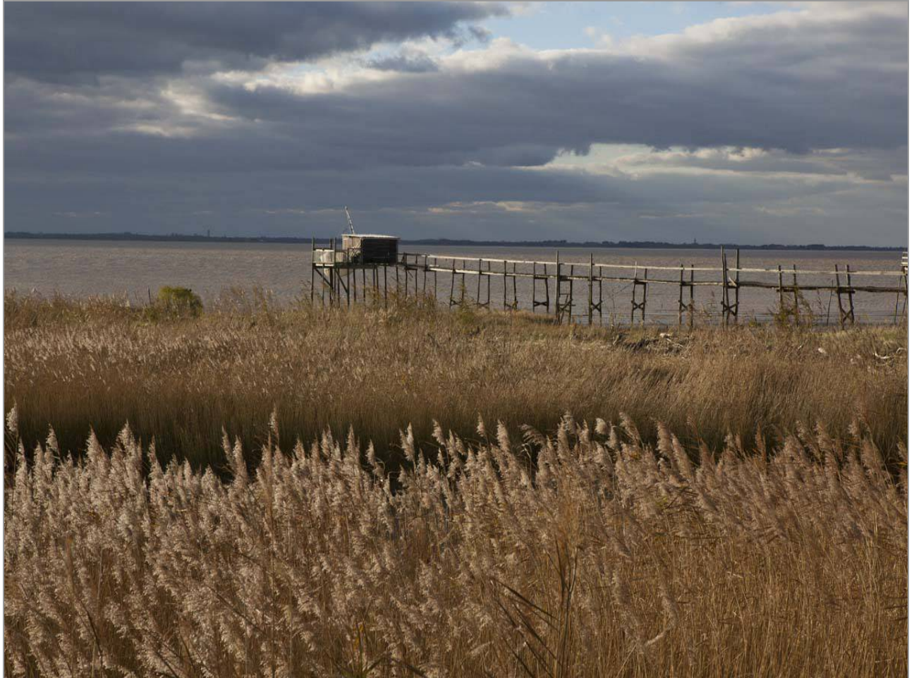
Roseaux et carrelet, dans le bot.