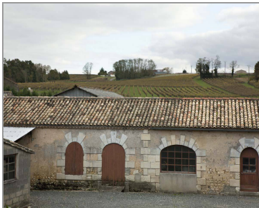
Ancien chai dans le bourg.