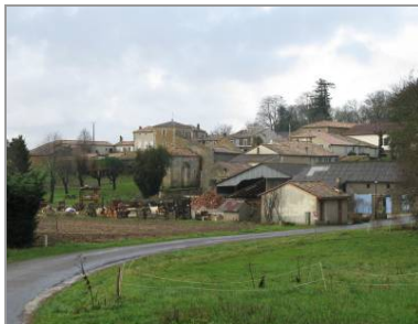
Le bourg, vu depuis la Mothe.

L'habitat est réparti sur le territoire communal de manière différente selon les deux principales entités géographiques qui le composent. Le coteau est ponctué de hameaux tandis que les marais desséchés sont marqués par un habitat isolé. C'est dans les hameaux que se concentre 90 % de l'habitat. Le bourg, très réduit, groupé autour de l'église, de la mairie et du domaine viticole du Château Saint-Sorlin, n'est guère plus important que d'autres groupements d'habitat comme la Poupotrie et la Déchandrie. Ces hameaux sont situés soit au sommet du coteau, comme la Rambauderie, soit sur les pentes des vallées qui l'interrompent, par exemple la Mothe.