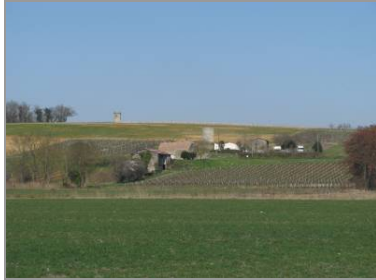
Le coteau de la Grenouille, lieu de découvertes archéologiques.