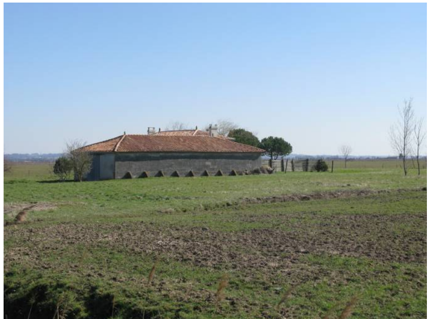
Métairie isolée dans les marais desséchés.

Dans les marais desséchés, on dénombre aujourd'hui 14 fermes ou anciennes fermes isolées au milieu des vastes terres exploitées. La plupart ne sont plus en activité. Presque toutes sont situées en limite de l'exploitation, au bord d'un canal et d'un chemin pour bénéficier de ces moyens de communication avec l'extérieur du Marais.