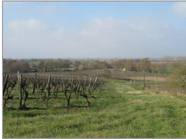
Des vignes aux marais, Chez-Ythier.