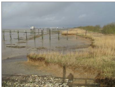
Le trait de côte rogné par l'estuaire, à Vitrezay, en janvier 2010.