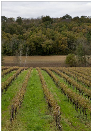
Vallon boisé et viticole près de Chez-Diot (C. Rome).