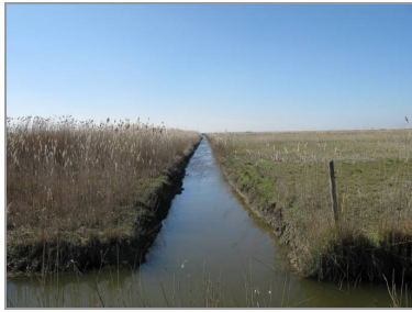
Un canal secondaire dans les marais desséchés.