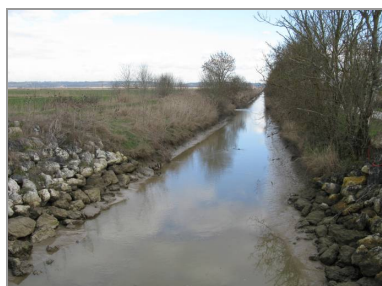
L'eau du dessèchement des marais qui arrive par le canal du Centre...