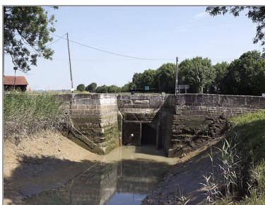
Écluse de chasse à Vitrezay (C. Rome).

À côté de ses paysages et de ses maisons et de ses (anciennes) fermes, Saint-Sorlin-de-Cônac présente plusieurs éléments du patrimoine intéressants du point de vue historique et/ou architectural.