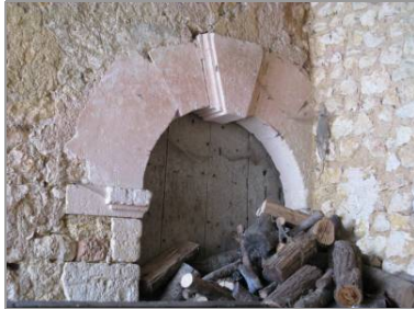
Porte du 17 e ou 18 e siècle, Chez-Signoret.