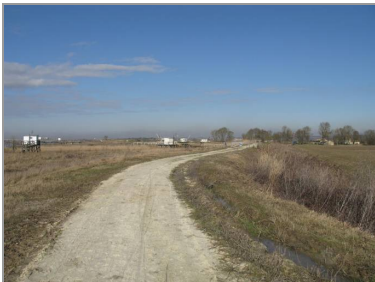
Le bot et ses carrelets (à gauche), la digue (au centre) et les marais desséchés (à droite).