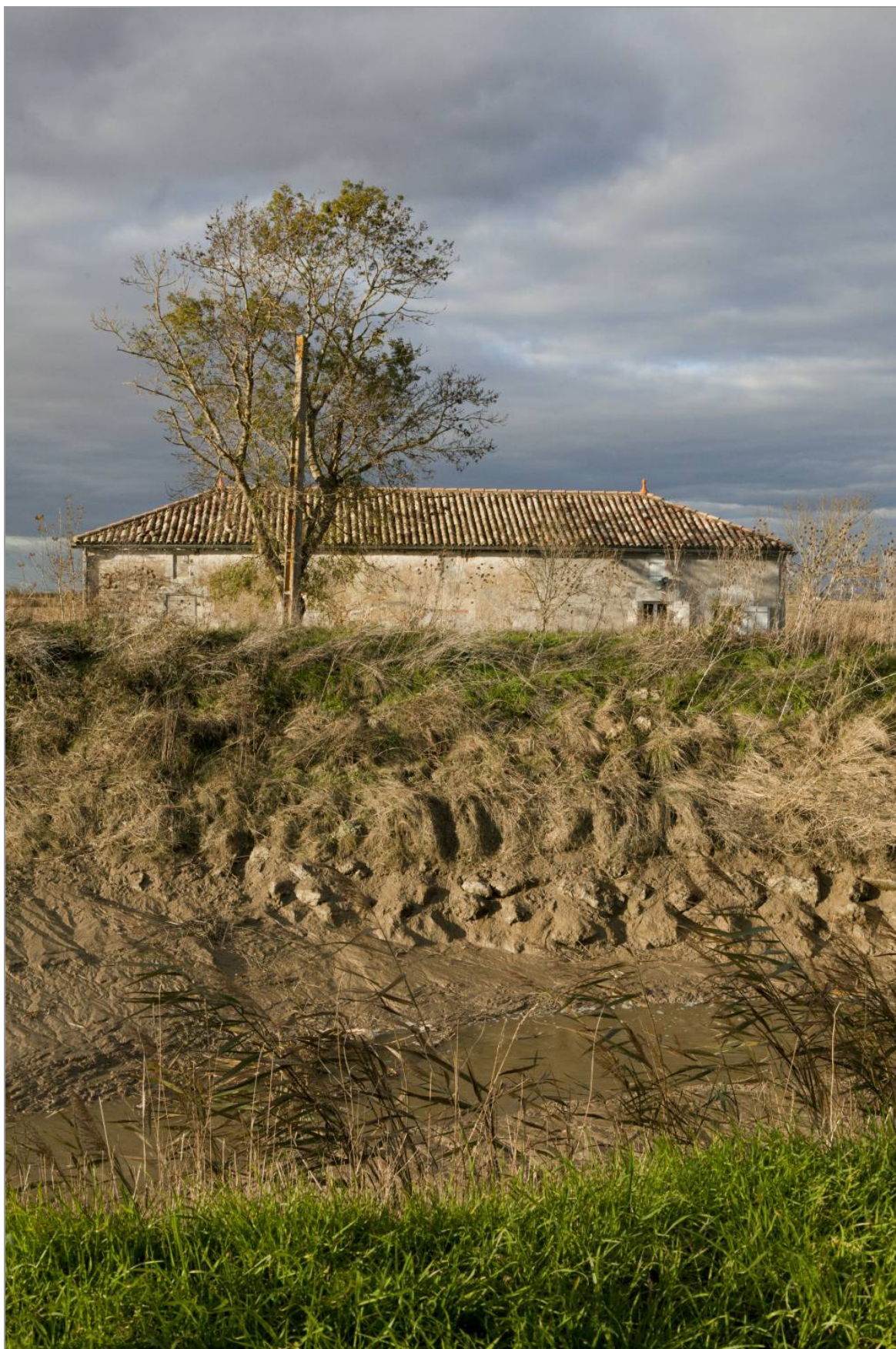
Ferme protégée par la digue au port de Côneac.