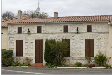
Maison de type saintongeais, avec comble et rez-de-chaussée séparés par un bandeau.