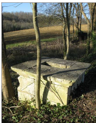
Fontaine route de Chez-Diot, construite en 1845 pour Jérémie Fourestier.