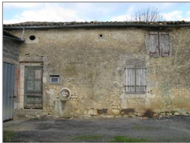
Ancien logis de ferme du 18 e siècle, à la Poupotrie...