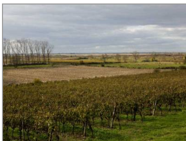
Vignes au bord de la Prairie (C. Rome).