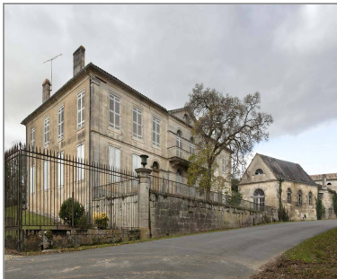
Le Château Saint-Sorlin (C. Rome).