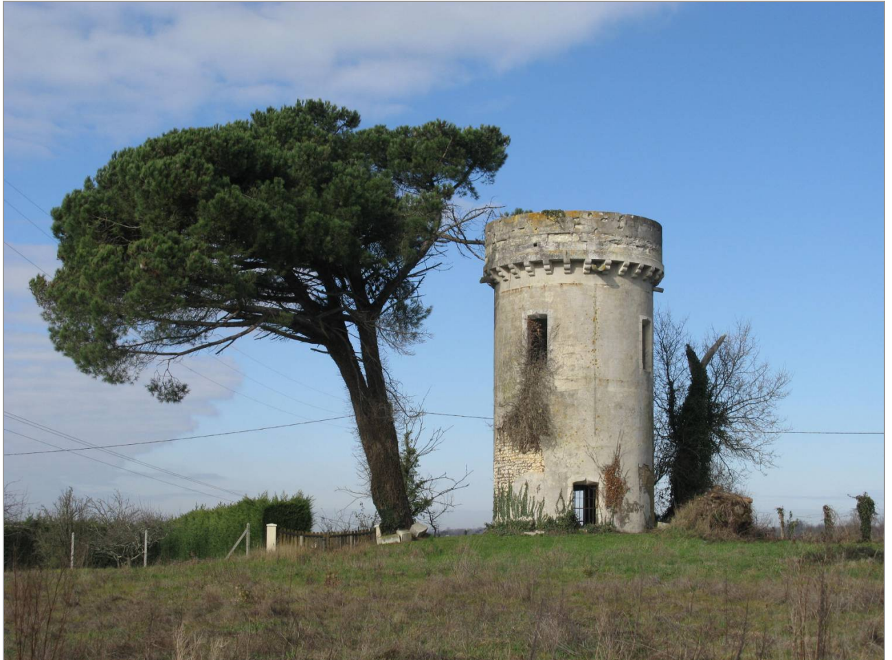
La tour de Mademoiselle Agathe, ancien moulin transformé en belvédère à la fin du 19 e siècle.