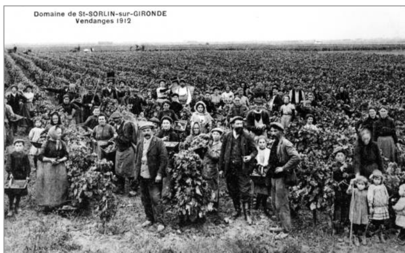
Vendanges en 1912 (dans Le canton de Mirambeau , 2003).

À l'automne 1939, Saint-Sorlin-de-Cônac accueille des réfugiés venus de Schweyen, en Moselle. Sous l'Occupation, des troupes allemandes s'installent un temps au Château Saint-Sorlin tandis qu'un réseau de résistance est actif dans les environs. Après la Libération, des prisonniers allemands sont mis à contribution pour remettre les canaux en état. Les marais desséchés et ceux de la Prairie ont en effet beaucoup souffert du manque d'entretien pendant les deux guerres mondiales. En février 1951, à la suite de graves inondations, il est décidé d'assainir les marais de la Prairie. Une association syndicale des marais de Saint-Sorlin est créée pour les gérer. Les travaux ont lieu entre 1956 et 1962 avec édification de digue, comblement de fossés, construction de chemins et de ponts, et remembrement des terres. L'électricité arrive dans les marais desséchés en 1952.