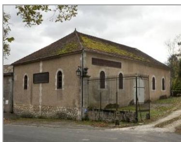
Chai au Château Saint-Sorlin (C. Rome).