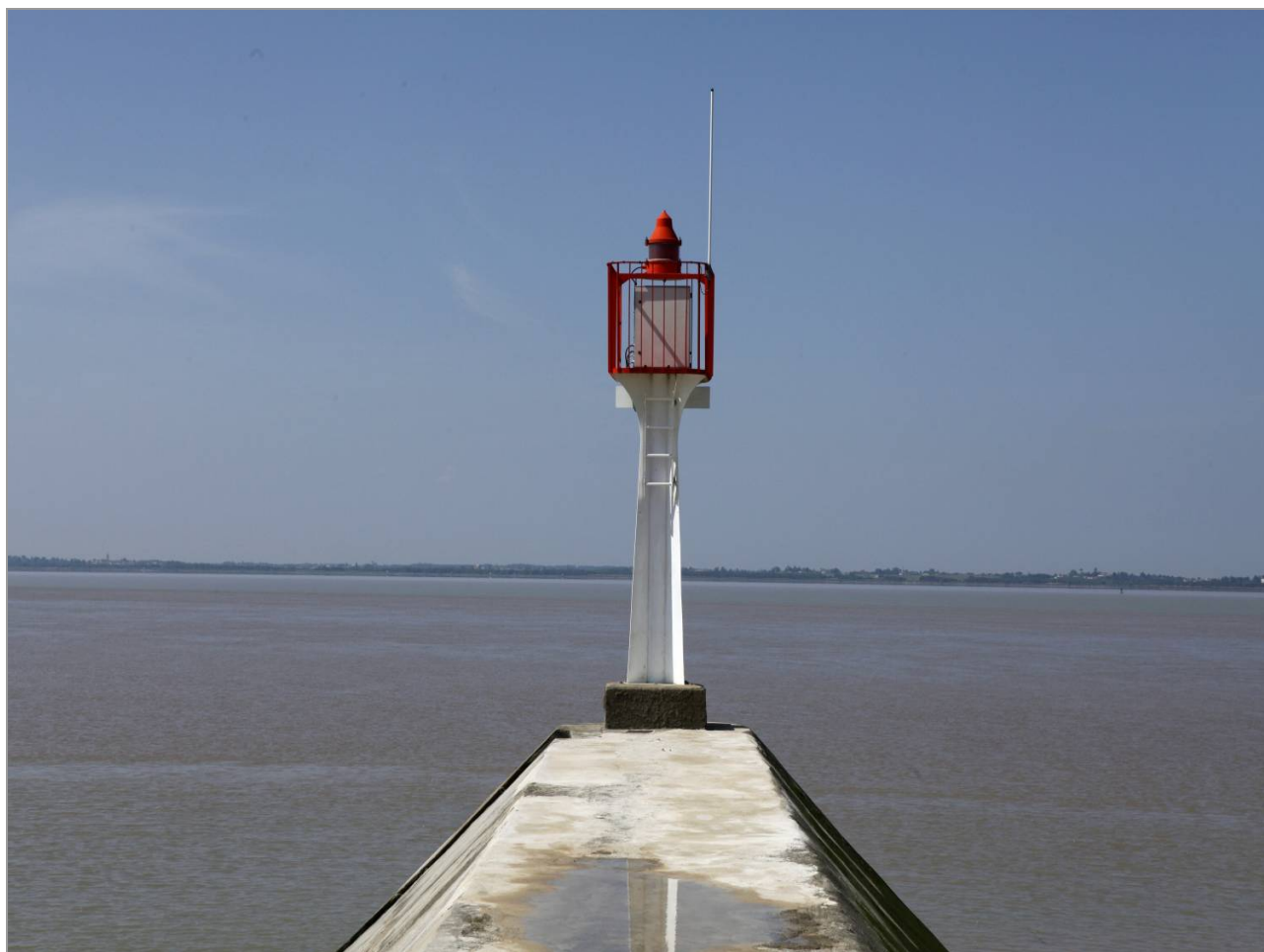
La jetée de Vitrezay.

> Région Nouvelle-Aquitaine Site de Poitiers Service Patrimoine et Inventaire 15 rue de l'Ancienne Comédie CS 70575, 86021 Poitiers Cedex Tél. : 05 49 36 30 05 s.patrimoine@nouvelle-aquitaine.fr www.inventaire.poitou-charentes.fr