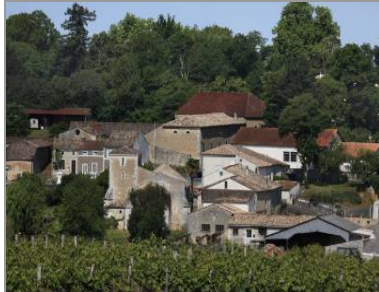
Le bourg vu depuis le sud.