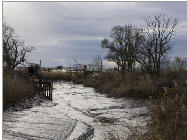
Chenal du port de Cônac.