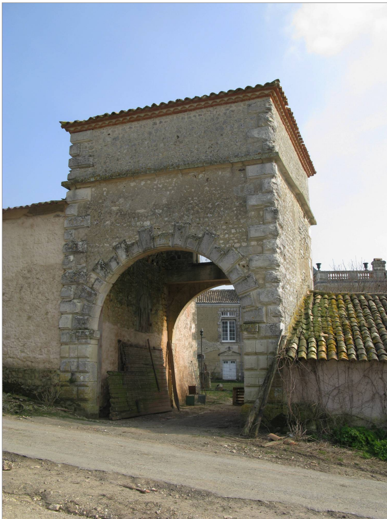
Pigeonnier-porche, aux Cheminées (17 e siècle?).