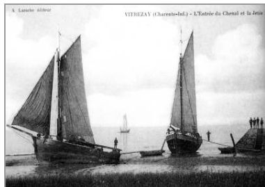
Le port de Vitrezay, vers 1900 (dans Le canton de Mirambeau , 2003).