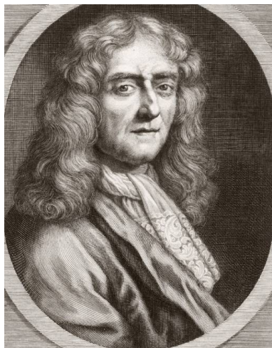
Portrait de Jean Desmaretz de Saint-Sorlin.