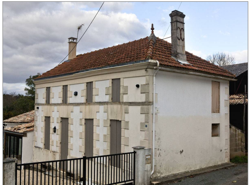
Maison Chez-Ythier, avec une croupe uniquement sur la droite.

La quasi totalité des façades principales est orientée au sud-est ou au sud-ouest, le bâtiment tournant le dos au nord et à l'ouest, d'où vient le mauvais temps.