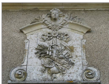
Détail sculpté représentant l'été à la Rambauderie.