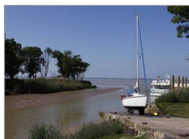
Bateau de plaisance au port de Vitrezay (C. Rome).

Malgré tout, l'exode rural s'accélère : la commune compte 399 habitants en 1954, 305 en 1968, 224 en 1982, 199 en 2009. Le phénomène aboutit à la réduction importante de certains lieux-dits, surtout les plus en retrait sur le coteau, comme les Pasquiers, voire à leur disparition comme le hameau Chez-Diot qui comptait 24 habitants en 1872 et plus aucun un siècle plus tard. En 1968, 23 maisons sont déclarées vacantes, soit 17 % du total. La dernière classe de l'école primaire ferme en 1974. Cette situation, ajoutée à la mécanisation agricole, se traduit aussi par un regroupement accéléré des parcelles, y compris sur le coteau, et par la forte diminution du nombre de fermes exploitées.