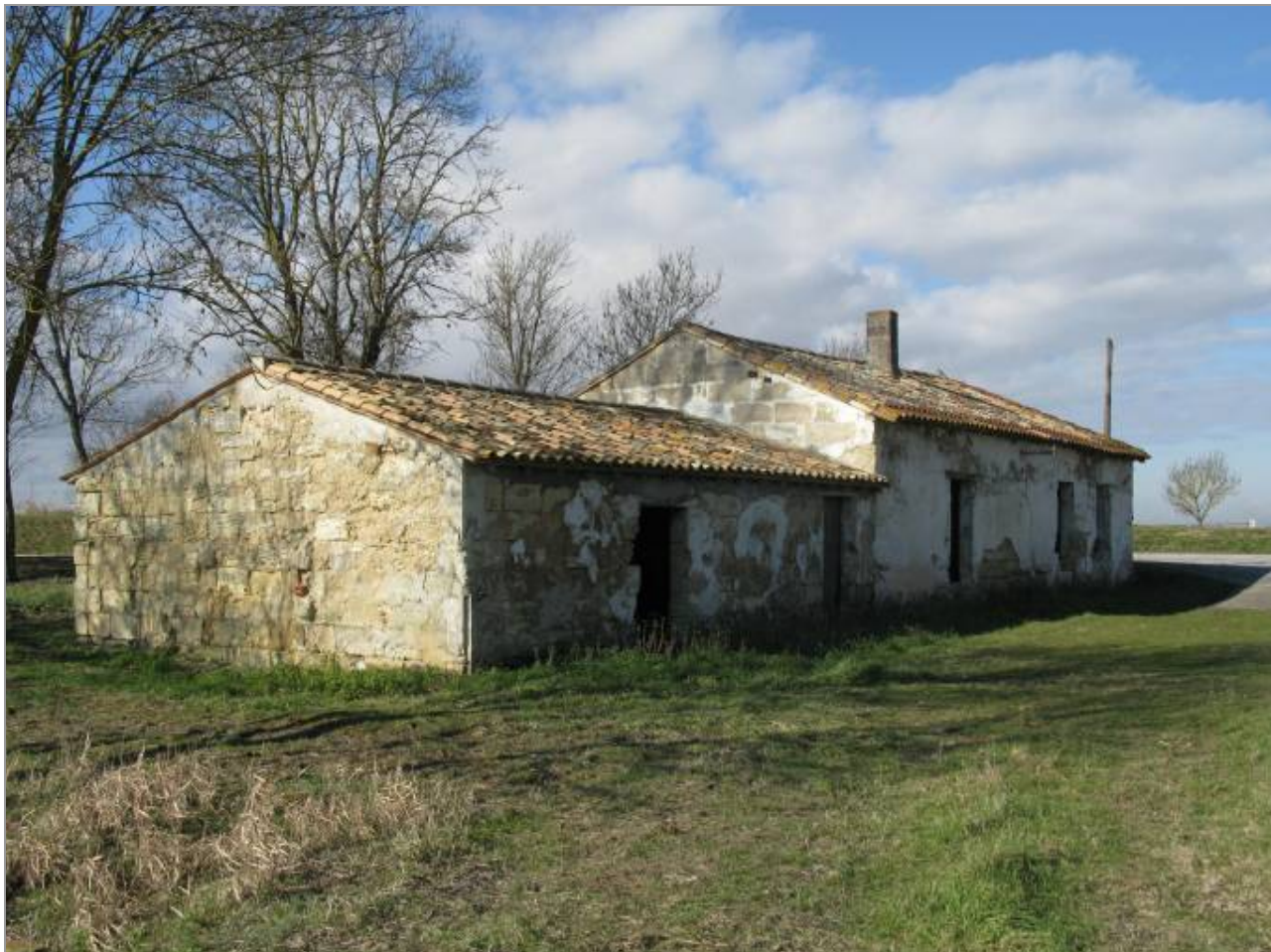
Ancienne maison du garde-éclusier des portes de Cognaac.