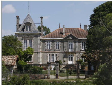
Le Mérim d'Or (C. Rome).