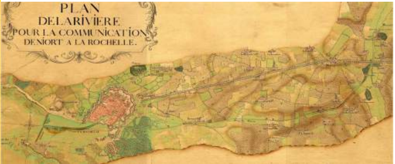
Extrait du plan de la rivière pour la communication de Niort à la Rochelle, 1756.

Dès le XVIII e siècle, les moyens de communication entre l'importante ville-port qu'était La Rochelle, son arrière-pays et le reste du royaume s'avèrent insuffisants. Les activités portuaires généraient en effet d'importants flux de marchandises. La Rochelle était notamment dépendante de la ville de Marans par laquelle transitaient nombre de denrées alimentaires à commercialiser (céréales) et de matériaux destinés à la construction navale (bois et chanvre). La route La Rochelle-Marans était encombrée par le trafic des charrettes chargées de marchandises et nécessitait un entretien aussi lourd que coûteux. Au milieu du XVIII e siècle, le mauvais état de sa chaussée la rendait quasiment impraticable durant l'hiver et par temps de pluie. Surtout, la Sèvre Niortaise, qui relie Marans à Niort et à l'arrière-pays, était sinueuse, envasée et soumise aux inondations. Cette situation, qui constituait un frein au développement des activités portuaires de La Rochelle, généra l'émergence de projets de liaisons complémentaires par voies navigables et le lancement des premières études pour la construction d'un canal reliant La Rochelle à Niort.