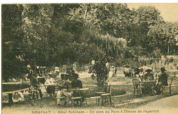
Le parc de la guinguette du Robinson à l'heure de l'apéritif. Carte postale du début du XX e siècle.

Le canal devint aussi un lieu de détente populaire très en vogue. En contrepoint du mail et des parcs Charruyer et d'Orbigny de l'ouest Rochelais, ses abords constituaient un grand espace vert à l'est de la ville. La guinguette du Robinson s'installa au début du XX e siècle au manoir de Beaupréau ; son agréable parc offrait par ailleurs un cadre idéal pour déjeuner ou prendre un café à la belle saison.