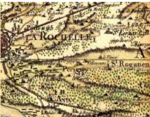
Le site du futur canal aux alentours de La Rochelle sur la carte de Cassini, 1771.

Dès le XVIII e siècle, les moyens de communication entre l'importante ville-port qu'était La Rochelle, son arrière-pays et le reste du royaume s'avèrent insuffisants. Les activités portuaires généraient en effet d'importants flux de marchandises. La Rochelle était notamment dépendante de la ville de Marans par laquelle transitaient nombre de denrées alimentaires à commercialiser (céréales) et de matériaux destinés à la construction navale (bois et chanvre). La route La Rochelle-Marans était encombrée par le trafic des charrettes chargées de marchandises et nécessitait un entretien aussi lourd que coûteux. Au milieu du XVIII e siècle, le mauvais état de sa chaussée la rendait quasiment impraticable durant l'hiver et par temps de pluie. Surtout, la Sèvre Niortaise, qui relie Marans à Niort et à l'arrière-pays, était sinueuse, envasée et soumise aux inondations. Cette situation, qui constituait un frein au développement des activités portuaires de La Rochelle, généra l'émergence de projets de liaisons complémentaires par voies navigables et le lancement des premières études pour la construction d'un canal reliant La Rochelle à Niort.