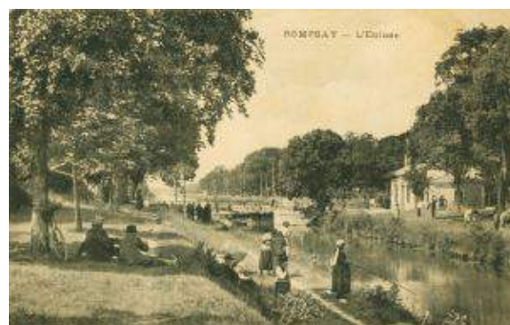
Le canal, lieu de détente populaire... L'écluse de Rompsay - Carte postale du début du XX e siècle.