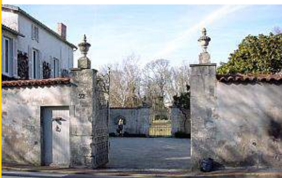
Portail et perspective d'une demeure à Périgny.

À défaut d'être l'axe de transport fluvial que le projet laissait espérer, le canal devint rapidement un espace de détente prisé. Son environnement agréable, propice aux promenades et à la pêche, favorisa l'aménagement de lieux de villégiature.