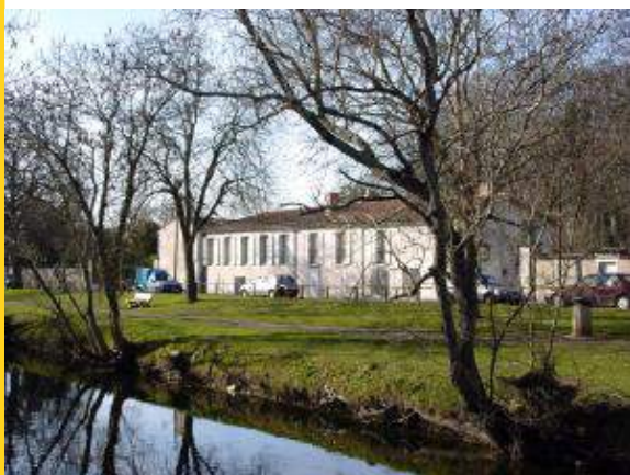
Le manoir de Beaupréau à Périgny.