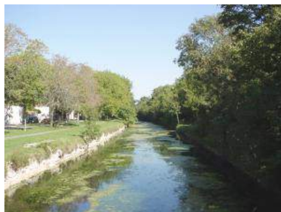
Le canal aujourd'hui.